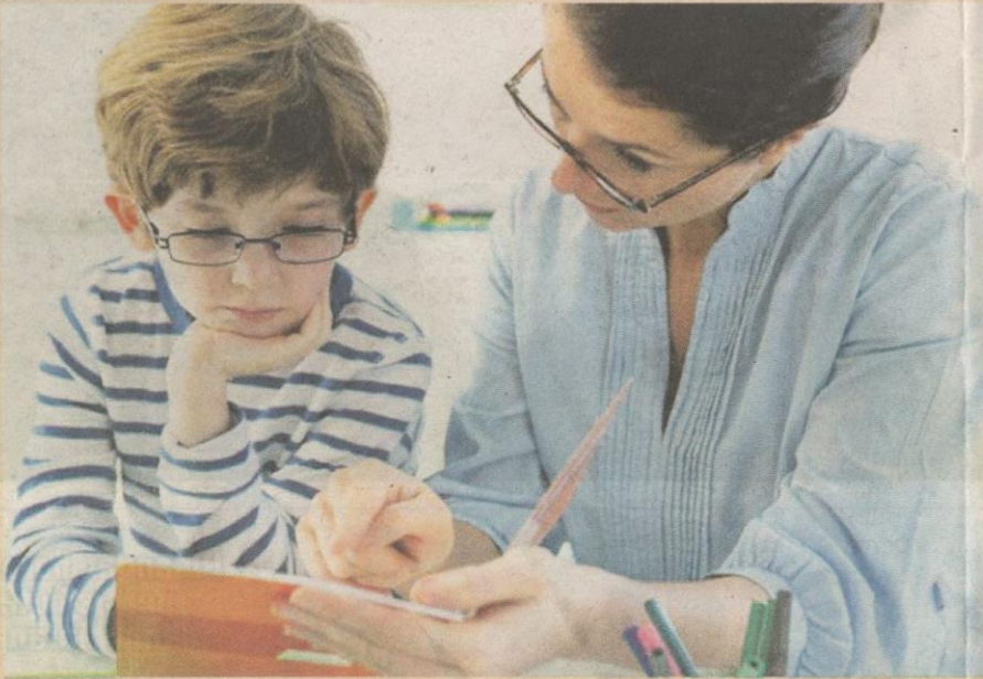
Sokongan secara berterusan dapat membantu anak disleksia berjaya dalam hidup.

Minggu ini Wow membawakan kupasan mengenai anak disleksia dan perkongsian dengan beberapa pihak bagi memberi pencerahan dalam membantu ibu bapa yang masih keliru mengenai perkembangan anak mereka.